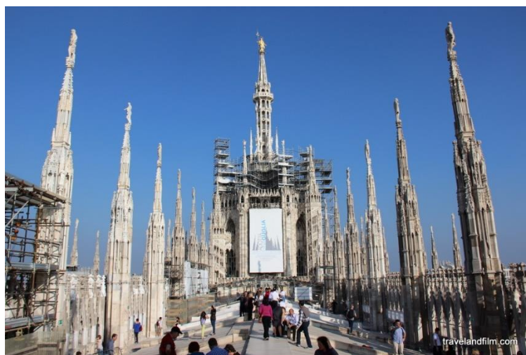
Les Terrasses de la Cathédrale de Milan